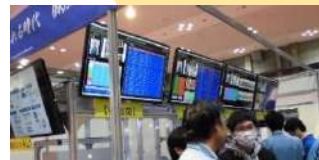
おとし2020年のEDCシステムの展示の様子

イベント中のデータは、「EDCシステム」で随時集計。“繋げる”“集める”“伝える”ことで、生産現場のデータ管理を楽にするEDCシステムの実演展示も同時開催です！